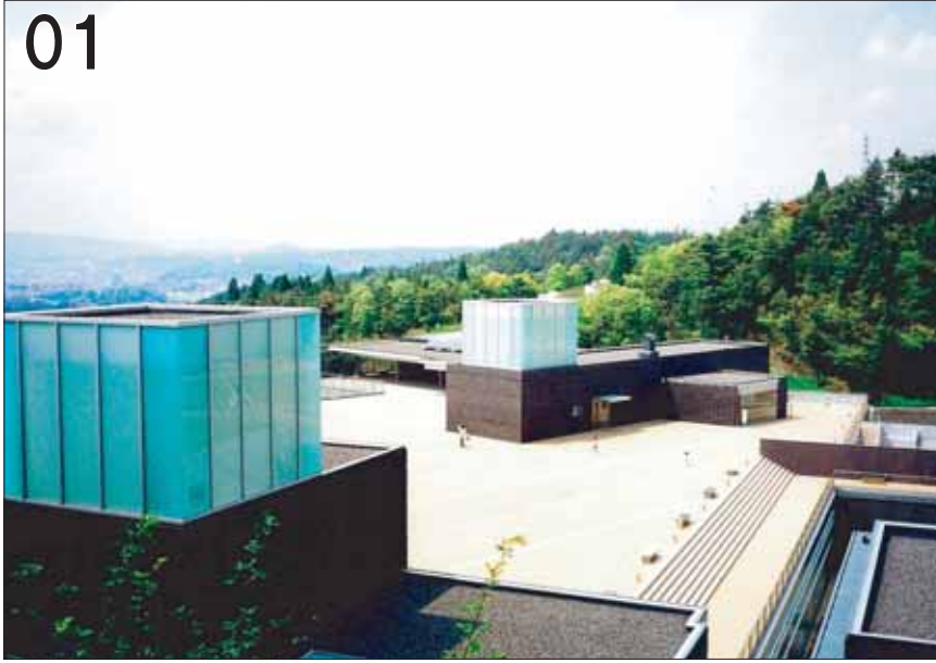
01 セラミックパークMINO ②岐阜県建設管理局公共建築課 磯崎新アトリエ ③多治見市東町4-2-5 ●地場産業である陶磁器と文化の融合をめざした日本でも珍しい複合施設です。多治見市を一望する山の中腹に建てられた施設は、険しい谷あいの地形を活かしながら、自然との調和が図られています。