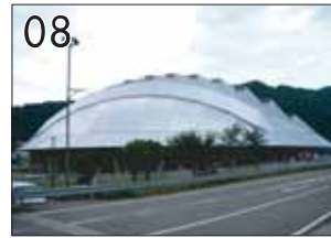
08 郡上八幡総合スポーツセンター「月舟蓋(げっしゅうがい)」 ②黒川哲郎+デザインリーグ ③郡上市八幡旭1130-1 ●銀色のカプトガニのようなドームは、樹齢300年の丸太を600本使用したダイナミックな架構でできています。