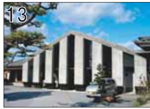
13 西福寺 ②高松伸建築設計事務所 ③可児市広見743-1 ●高松伸お得意の宗教建築です。一見、切妻と列柱のおとなしい建築ですが、列柱の裏には複雑な造形の空間が隠されています。