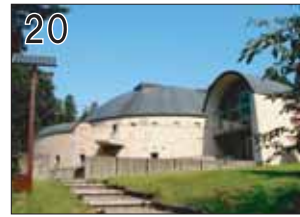
20 日本昭和音楽村 江口夜詩記念館 ②都市造形研究所 ③上石津町大字下山2011 ●建物はホルンの形をイメージした渦巻き状のプラン。ゴンチチなどのメジャーなアーティストが格安でライブを行います。