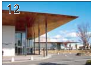
12 可児市文化創造センターala ②香山壽夫建築研究所 ③可児市下恵土3433-139 ●市民参加による設計が話題となった施設です。各セクションを覆う2層吹き抜けの大屋根が、ダイナミックな空間の連続性を演出しています。