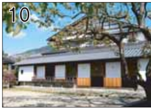
10 藤村記念館 ②谷口吉郎 ③岐阜県中津川市馬籠4256-1 ●記念すべき建築学会賞第1号作品。入口左の壁に掛けられた、谷口氏直筆の設計趣旨書は必読です。