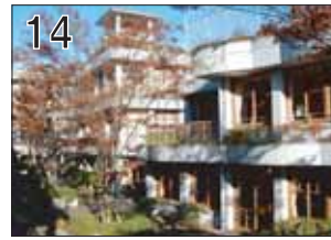
14 多治見中学校 ②象設計集団 ③多治見市美坂町4-10 ●建物が圧倒的な量の緑に埋め尽くされた中学校です。教室からは、ウッドデッキが敷き詰められた中庭へすぐに出入れます。