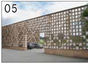
05 岐阜県立飛騨牛記念館 ②北川原温建築都市研究所 ③高山市清見町牧ヶ洞4393-1 ●飛騨牛についての資料を展示解説してくれる施設ですが、建築を見に来る人の方が多いとか。