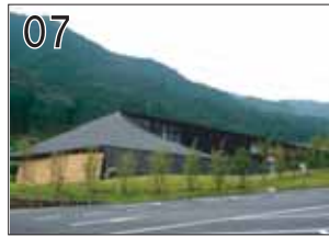
07 南飛騨・健康学習センター ②岐阜県公共建築課 奥山信一研究室+佐藤安田設計JV ③下呂市萩原町四美1557-3 ●骨振動レベルや体組成計測など、さまざまな計測器具で、楽しみながら健康チェックができます。