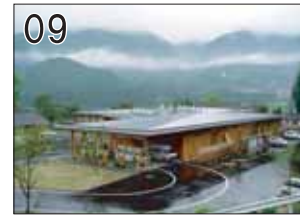
09 加子母村ふれあいコミュニティセンター ②安藤雄雄建築研究所 ③中津川市加子母中切3427-1 ●地場産の木材を集成材として用いた木造建築です。耐力壁を使わず、V字型の柱の採用により開放的な空間を造っています。