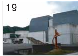
19 谷汲サンサンホール ②大建設 met ③揖斐川町谷汲名礼262-22 ●図書館、多目的ホール、マルチメディア館から成る複合施設。円形の図書館はトップライトのある明るい吹き抜け空間となっており、重厚なコンクリート壁が印象的な建物です。