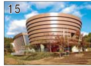
15 サイエンスワールド ②仙田満+環境デザイン研究所 ③瑞浪市明世町戸狩字大狭間54 ●体験を通して子供に科学の楽しさを知ってもらうための施設です。円形の建物内部では科学実験ライブショーが開催されています。