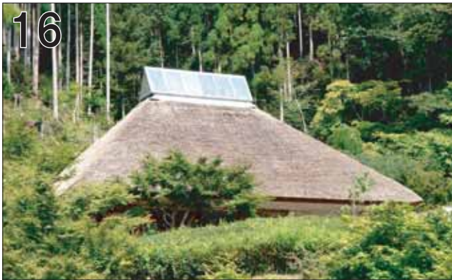
16 古今伝授の里 フィールドミュージアム ②龍光夫 ③郡上市大和町牧912-1 ●茅葺屋根の鉄骨造という日本唯一の建築。小屋裏空間はトップライトまで吹き抜けになっていて、前面の池からの反射光とともに、明るい多目的ホールが造られています。