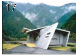
17 村のテラス「森呼吸」 ②渡辺誠/アーキテクトオフィス ③揖斐川町坂内広瀬南川尻77 ●坂内川にテラス状に張り出したオブジェのような建築です。残念ながら施設は閉館中でした。