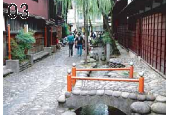
03 やなか水のかみち ②象設計集団・アトリエ修羅 ③郡上市八幡町新町 ●象設計集団が得意とする有機的な造形や素材感は、水の郷にふさわしい親水空間を創造しています。