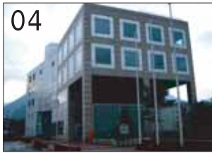
04 旧神岡町役場 ②磯崎新アトリエ ③飛騨市神岡町東町378 ●立方体や半円形、有機的な壁面など複雑な要素で形態と機能を構成しています。市町村合併で現在は神岡振興事務所となっています。