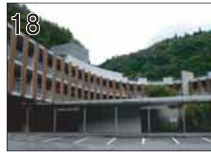
18 揖斐郡北西部地域医療センター 山びこの郷 ②鈴木孝紀+長島一道/HAL ③揖斐川町東津汲877-1 ●療養所と公衆浴場等から成る施設。背後の山並みに合わせるかのように湾曲した建物は半分が個室、半分が開放的なテイルームになっています。