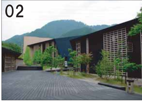
02 岐阜県立森林文化アカデミー ②北川原温建築都市研究所+エース設備設計 ③美濃市曾代88 ●この建物は間伐材を出来るだけ多く活用するため、さまざまな試みがされています。外部のルーバー状の格子は小径材で耐力壁を造るためのアイデアです。