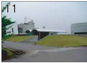
11 NBK関工園事務棟・ホール棟・MEMEセンター・元気亭 ②大野秀敏+アブル総合計画事務所 ③関市倉知向山 ●機械メーカーの工場内に建つ事務所施設。グッドデザイン賞はじめ数多くの賞を受賞。