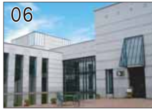
06 飛騨高山美術館 ②KAJIMA DESIGN ③高山市上岡本町1-124-1 ●アールヌーヴォーのガラス芸術を展示する美術館。建物はC. R. マッキントッシュのスタイルでデザインされ、展示物を引き立たせています。